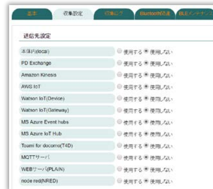
WEB UI 画面(クラウド設定画面)