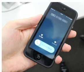
『Alert Callサービス』からの音声通話着信の様子

けば電話を取ります。そういうICTとアナログの融合と言いますか、それぞれの長所をうまく組み合わせました」と話す。また、この音声通報システムは『M-Connect』自体に音声回線を持たせる必要がなく、Alert Callサービスのサーバーへ通信できる環境(インターネットへ接続できる環境)さえ確立されていれば、あとはサーバーから音声発信をする為、導入の容易さも併せ持っている。