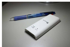
ボールペンと『OpenBlocks IoT BX1』のサイズ比較

『M-Connect』のベースハードウェアを選定するうえで重要視した点を本橋氏に聞くと「大きくわけると3つあります。1つ目は低コストである事。3G通信モジュールが搭載されているのにコストパフォーマンスが非常に高いと思いました。2つ目は信頼性の高さですね。出来るだけノーメンテのハードウェアを選びたかったので、国内製造かつ、国内メーカーさんのもの