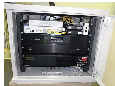
OpenBlocks 600 (右上) と VSAT システム構成機器

「(初期開発にかかった時間は)小一時間くらい。一度リモートで接続する方法さえつくれば、あとは船に乗せて必要な機能を随時足してゆく、といった形で導入を進められ、非常にスマートでした。故障などもなく、ぶらっとホームのWebサイトで提供されている技術情報を少しだけ参照したくらいのものです。」