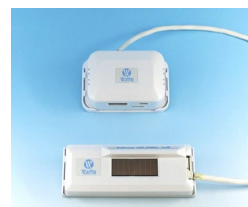
換気センサー（二酸化炭素センサー） HYCO