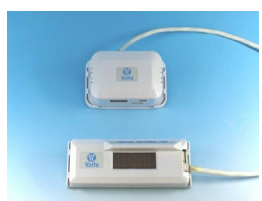
換気センサー（PM2.5センサー） HYPM