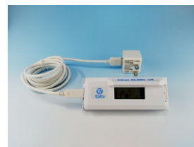
ワンホップ中継器 HSJ