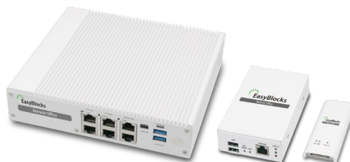
「EasyBlocks® Remote Office」 親機(左)・有線対応子機(中)・無線対応子機(右)

「EasyBlocks Remote Office」の発表以来、テレワークへの移行が急務であるお客様より多数のお問い合わせをいただきましたが、これまで子機は有線 LAN に対応したモデルしかなく、自宅内に無線 LAN 対応の PC しかないケースでは本製品の導入は困難でした。